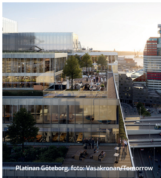
Platinan Göteborg, foto: Vasakronan/Tomorrow

Till Platinan i Göteborg, som är en av Göteborgs modernaste byggnader levererade vi två stycken helautomatiska fettavskiljare. Anledningen till att de valde vår helautomatiska fettavskiljare var dess vinning med eliminering av dålig lukt vid tömning och att de minskade tömningstiden.