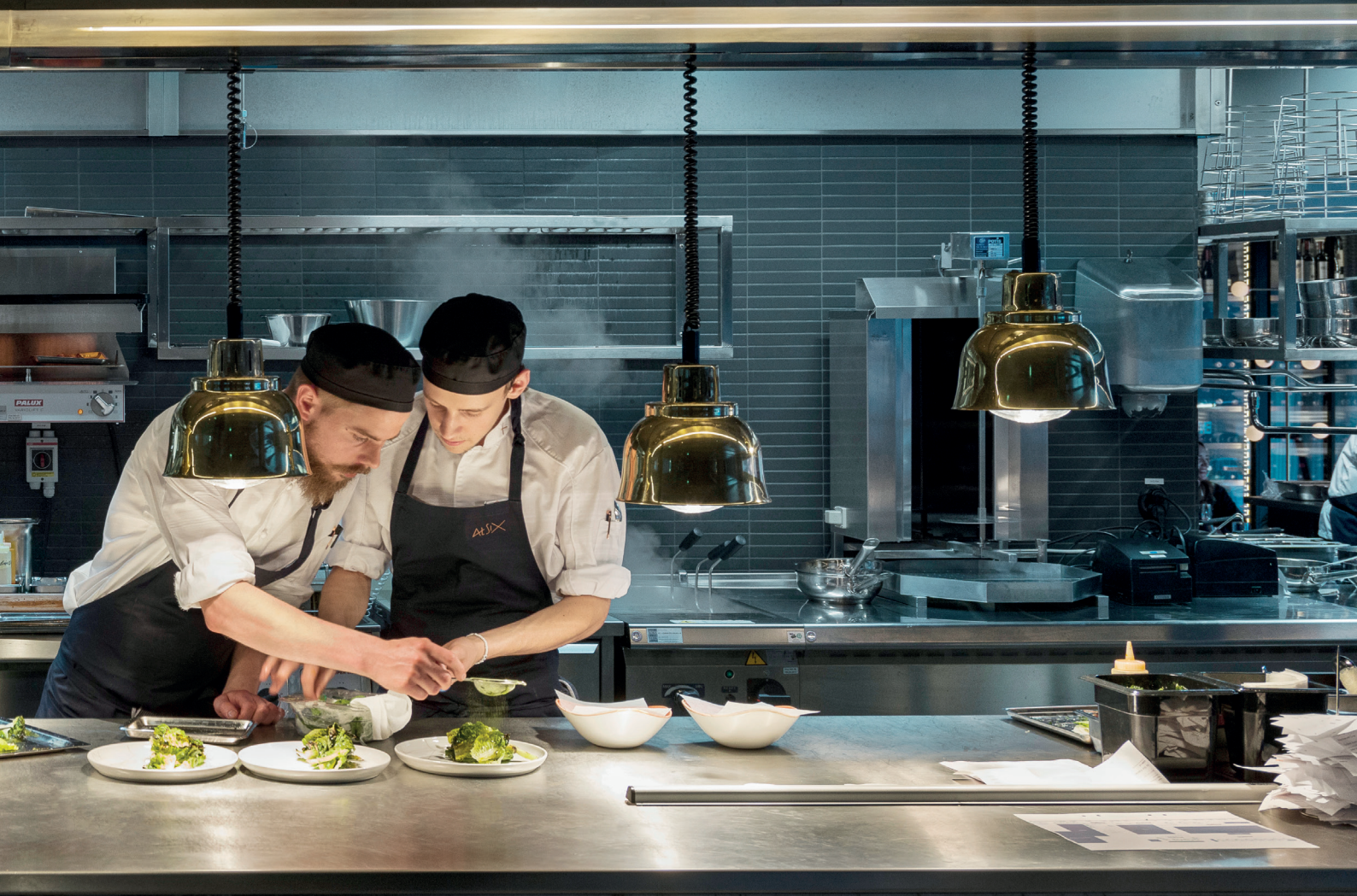
Hotel At Six, Stockholm